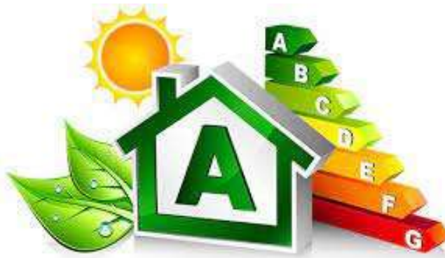
Servicios de eficiencia energética