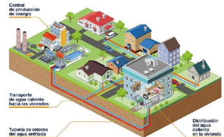
Centrales de calor de biomasa